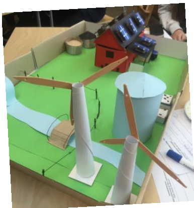
Modeller av bidrag i en Gründercamp.

I læreplanene for grunnskole og videregående opplæring omtales entreprenørskap som et virkemiddel til å fornye opplæringen og gjøre unge rustet til å møte en verden i rask endring. Å bygge opp elevers entreprenørskaps-kompetanse bør skje med en god progresjon gjennom hele utdanningsløpet. Gründercamp er et tiltak som kan gjennomføres for å lære elevene om entreprenørskap. Gjennomført tidlig på året er det også en egnet måte å «riste» sammen elevene på.