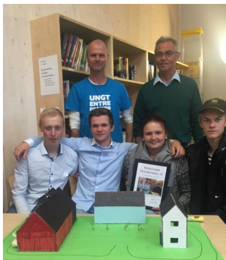
Vinnerteamet på Mære med sin modell av et gårdsbruk med flere energieffektive grønne tiltak! (2015)